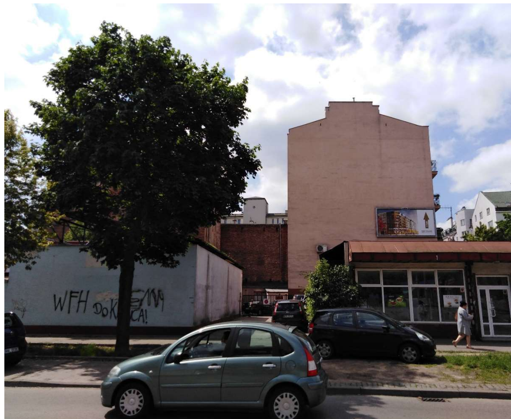
Widok połączenia oficyny z sąsiednią zabudową