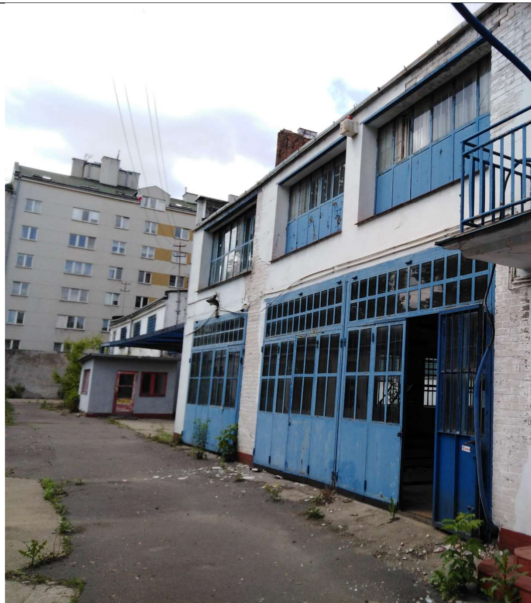
Zabudowa działek przeznaczona do rozbiórki